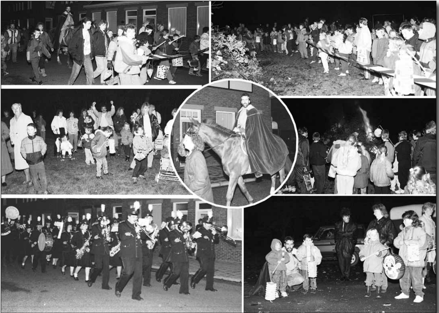
"Uit de oude doos: de Sint Maartenoftocht en bijbehorend vuur rond 1990".